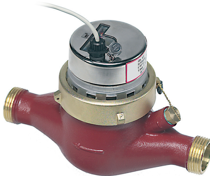
AN 130, montage Horizontal

Compteur pour eau chaude jusqu'à 130 °C, PN 16