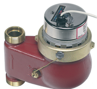
SAN 130, montage Vertical Ascendant