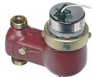
FAN 130, montage Vertical Descendant